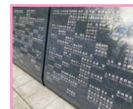
記名板(モニュメント周囲)