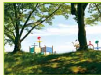
(アスレチック広場)

当霊園は大阪府東部と奈良県北部、京都府南部を結ぶ国道163号線に面し、金剛生駒国定公園に接した、緑豊かな自然環境にあります。サクラやツツジが咲き誇り、イチョウが舞い散る歴史の丘は、故人の方と共に、未だここに在り続けます。